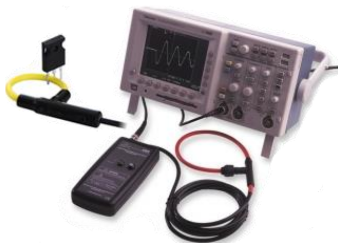
Anwendungsbeispiel mit einem Oszilloskop und Darstellung an einem Bauteil