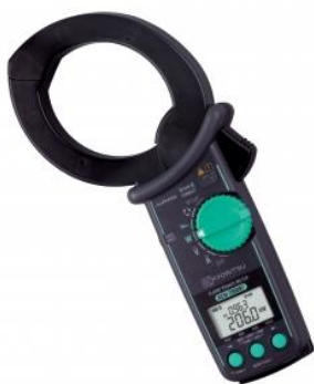
KEW-2060BT (mit Bluetooth)