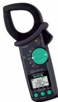
KEW-2062BT (mit Bluetooth) KEW--2062