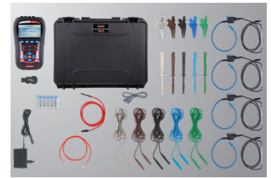
Abbildung MI 2892 AD