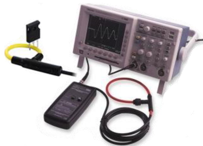
Anwendungsbeispiel mit einem Oszilloskop und Darstellung an einem Bauteil